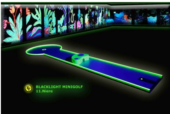
Bahn 11: "Niere"