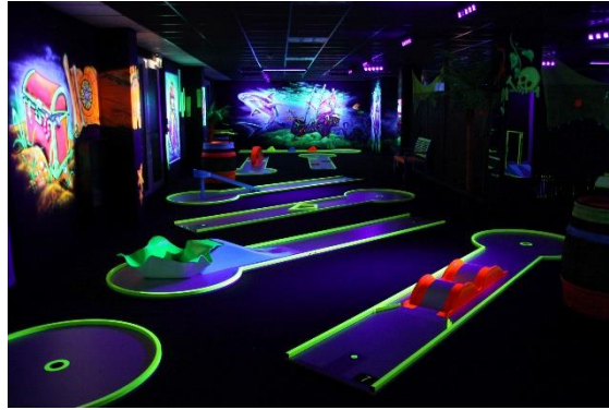
Bildbeispiele: „www.black-island.de“ Itzehoe