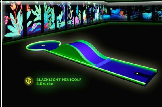
Bahn 8: "Brücke"