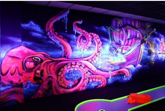
Bildbeispiele: Wandbemalung im „www.black-island.de“ Itzehoe