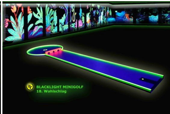
Bahn 18: "Wahlschlag"