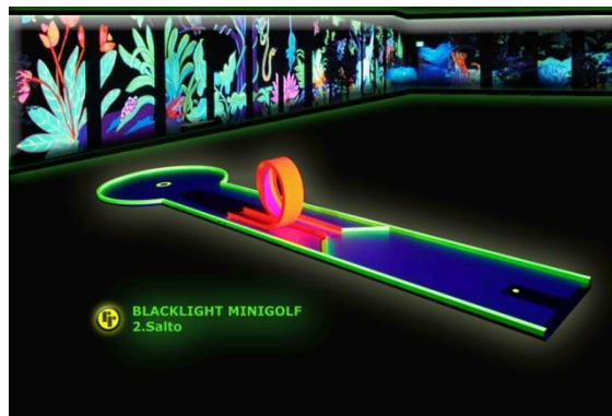
Bahn 2: "Salto"