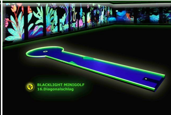
Bahn 16: "Diagonalschlag"