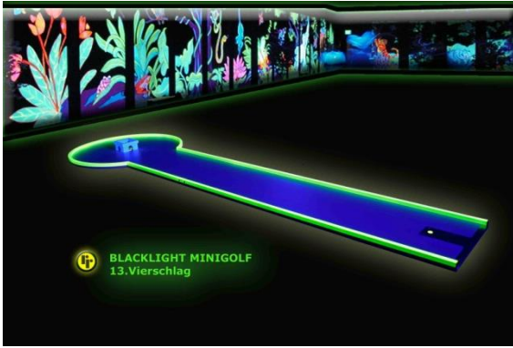
Bahn 13: "Vierschlag"