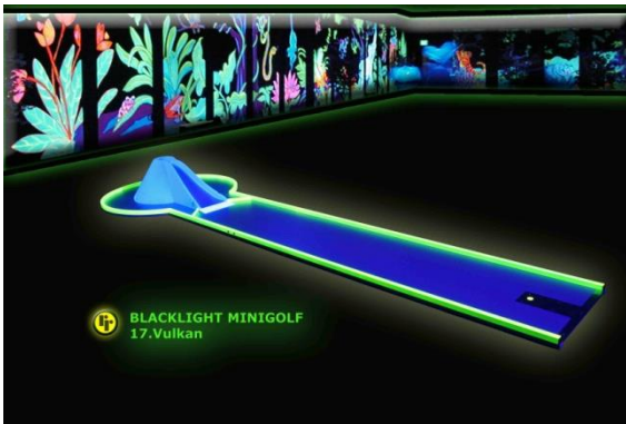
Bahn 17: "Vulkan"