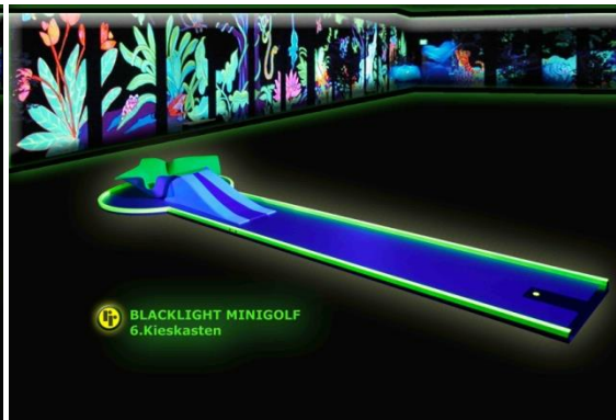
Bahn 6: "Kieskasten"