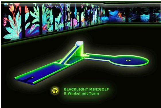
Bahn 9: "Winkel im Turm"