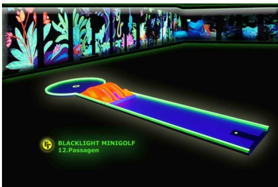
Bahn 12: "Passagen"