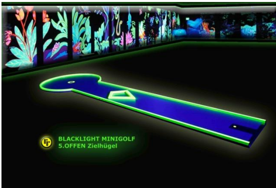
Bahn 5: "offener Zielhügel"