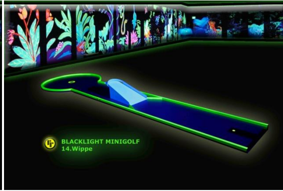
Bahn 14: "Wippe"