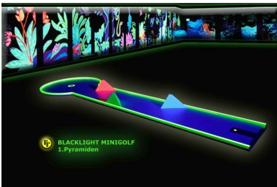
Bahn 1: "Pyramiden"

Nachfolgend eine genaue Übersicht der verschiedenen Hindernisse einer 18 Bahnen Mini-Golf-Anlage (die Abbildungen zeigen alle mit einer fluoreszierenden Beschichtung hergestellten Bahnen).