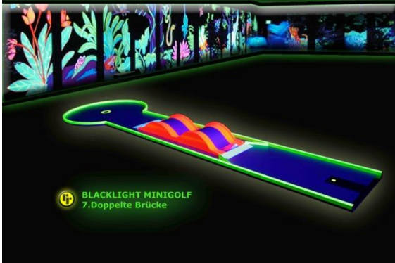
Bahn 7: "doppelte Brücke"