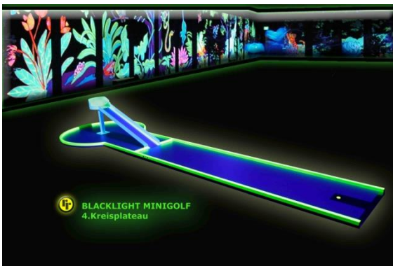
Bahn 4: "Kreisplateau"