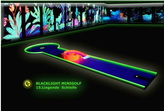
Bahn 15: "Liegende Schleife"