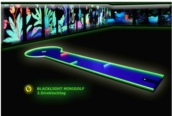
Bahn 3: "Direktschlag"